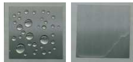
ステンレス板にコーティングした酸化チタン薄膜の超親水化 (左：照射前・右照射後)

光触媒を建材や内装材にコーティングしたり、空気清浄機などでつかったりする場合には、かならず空気中の酸素が存在します。酸素は、光触媒に生じる励起電子をうけとりやすいので、光触媒反応によっておこる酸化と還元のうち、還元は酸素に対して起こることになります。酸素が励起電子によって還元されると、さまざまな酸素活性種が生じることがわか