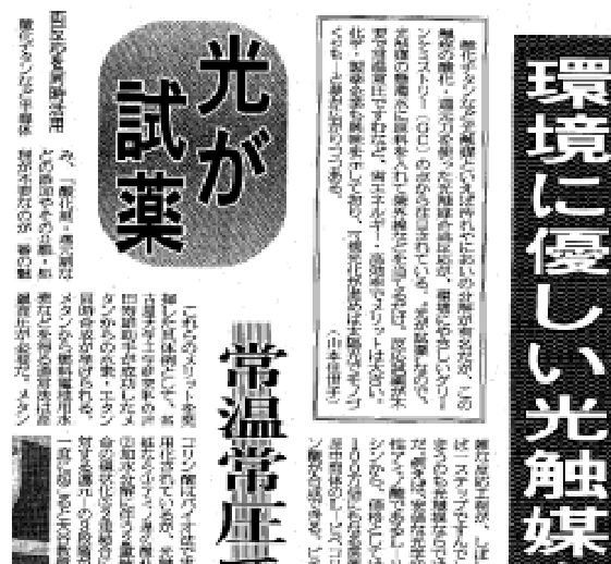
日刊工業新聞で紹介された光触媒反応による有機合成

光触媒反応は、クリーンな化学反応です。通常の化学薬品の合成方法とはちがって、水を溶媒として利用できますし、加熱する必要もなく、また、むだなあまりものが生じません。もうひとつの大きな特長は、励起電子と正孔による還元と酸化が、わずか数マイクロメートル以下の小さな光触媒粉末のひとつひとつの粒子の上で同時に進行することです。ふつうの化学反応で、酸化剤による酸化と還元剤による還元を同時に行おうとすると、酸化剤と還元剤が反応してしまいます。電気分解反応で、2つの電極をちかづけすぎるとショートしてしまいます。これに対して、光触媒反応では、光をあてることによって、酸化と還元の両反応を同時に進行させることができます。これを応用した例として、必須アミノ酸の一種であるL-リシンを原料とするピペコリン酸合成があります。ピペコリン酸は、医薬品などの中間原料として重要な化学物質ですが、1段階の触媒反応で合成する方法がありませんでした。光触媒反応を利用すると、原料の酸化と還元が順序よく進行して、ピペコリン酸を高い効率で合成することができます。この光触媒反応による有機合成のように、有機溶媒や有機化合物の試薬をつかわず、無駄な副生物なしに、温和な条件でおこなう化学反応を、『グリーンケミストリー』とよびます。環境をまもるためには、すでに存在する有害な化学物質を除去する技術にくわえて、環境にやさしい生産技術の開発も重要です。