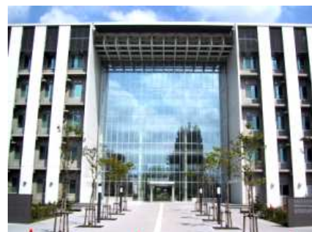
触媒化学研究センターのある創成科学研究棟のガラスは酸化チタンがコーティングされている。