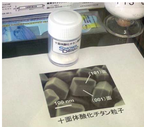
研究室で開発され、工業化された「十面体形状アナターズ型酸化チタン」

応しやすいような構造が必要です。さらに、励起電子-正孔が再結合しにくい特性も大切です。再結合とは、励起電子と正孔が反応して、なにも化学反応がおこらないまま（実際には熱が生じる）もとの状態にもどってしまうことです。これらの条件を同時に満足する高性能光触媒の開発がすすんでいます。右の写真は、従来法とはまったく異なる新しい手法によって調製した高性能酸化チタン光触媒微粒子で、すでに企業に技術移転され工業化されています。