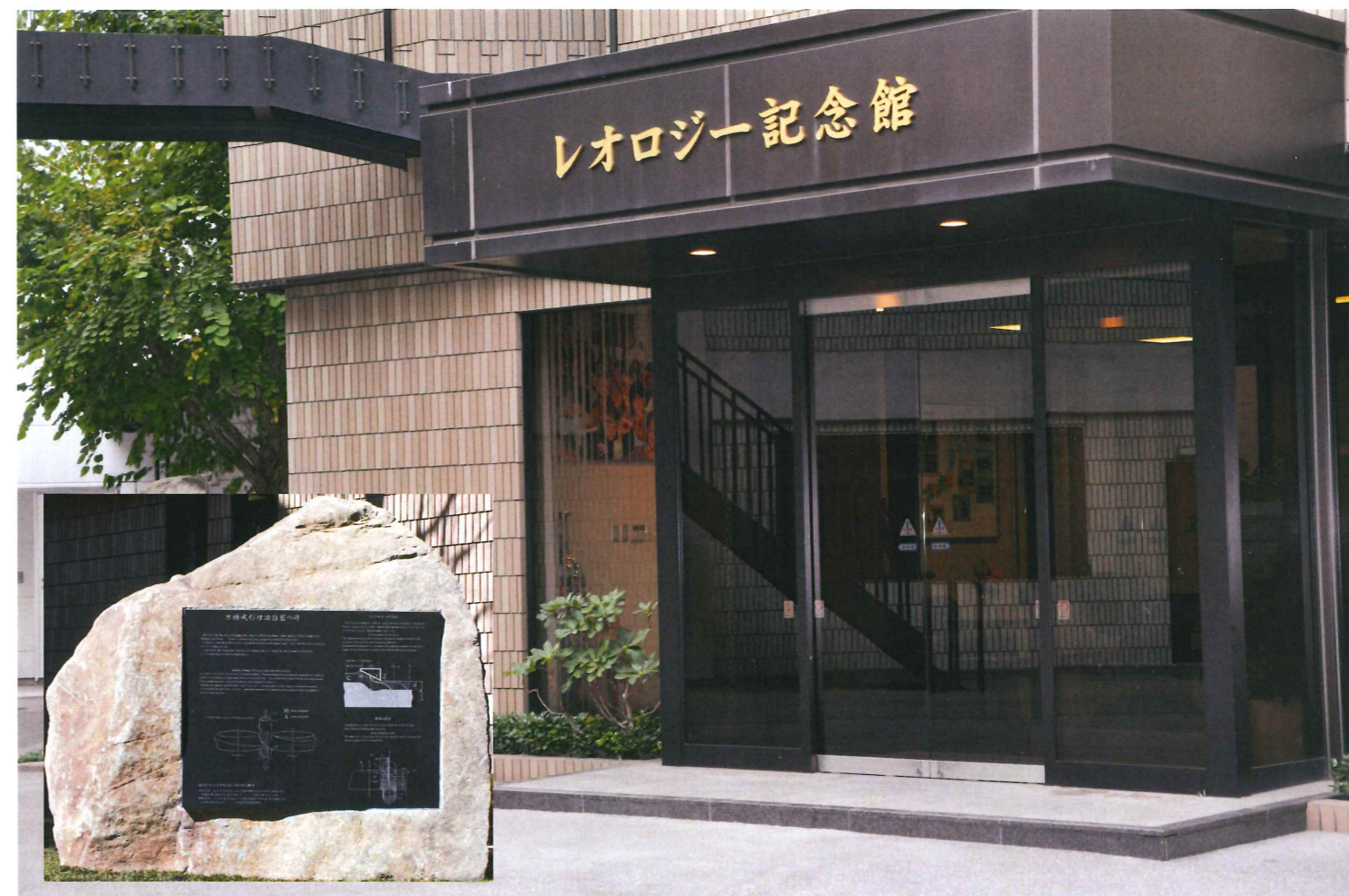
饅頭成形理論揺籃の碑