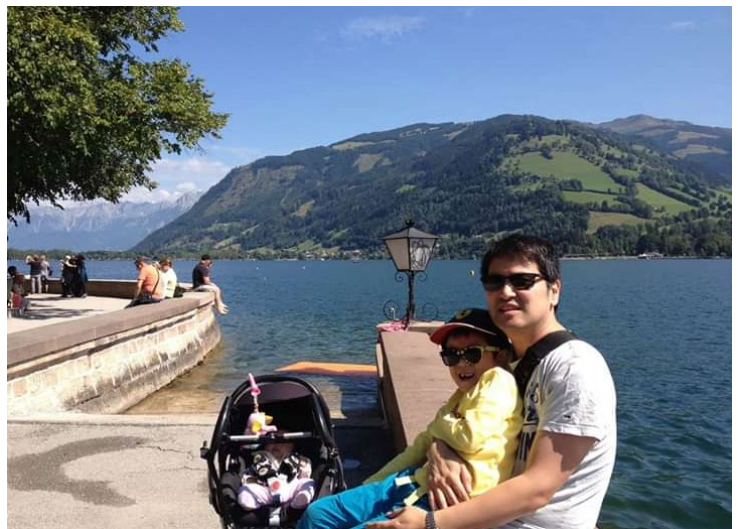
欧州駐在中の旅行先 Zeller 湖（オーストリア）にて