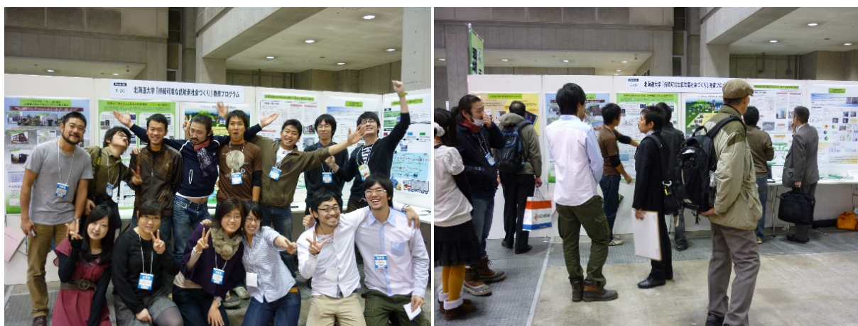
写真:「エコプロダクツ」で大学キャンパスの 環境負荷の低減に向けた北大の取組を紹介したブースでの出典の様子

環境科学院の学生さんには研究とは関係のない就職をする方も多くいらっしゃると思いますが、何事にも自主性をもって積極的に取り組んでいただき、環境科学院で学んだことを将来へと繋げていただきたいと思います。